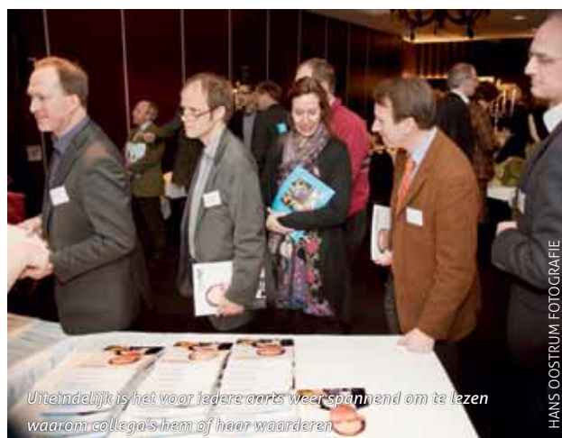
Uiteindelijk is het voor iedere arts weer spannend om te lezen waarom collega's hem of haar waarderen