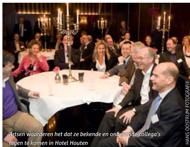
Artsen waarderen het dat ze bekende en onbekende collega's tegen te komen in Hotel Houten