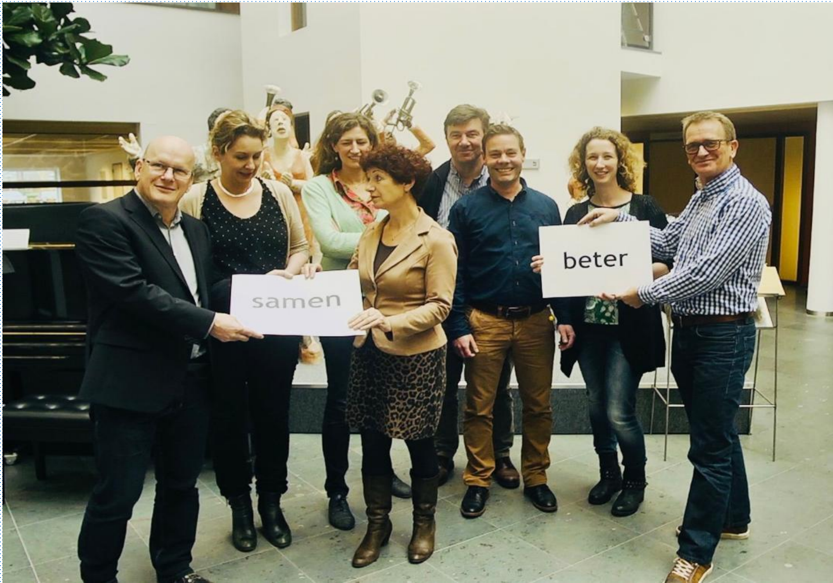
Team bipolair 2014